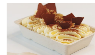
Nombre de café y cacao Coste por ración: 0,30€