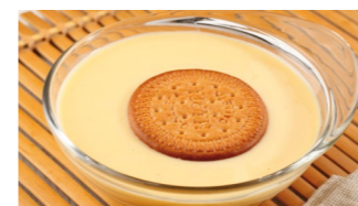
Natillas con galleta Coste por ración: 0,28€