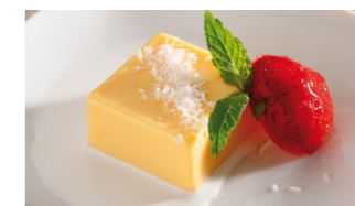
Miniflan de coco Coste por ración: 0,37€