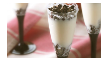
Sorbetto de limón y café Coste por ración: 0,22€