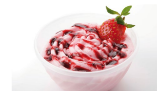
Mousse de fresa con sirope Coste por ración: 0,30€