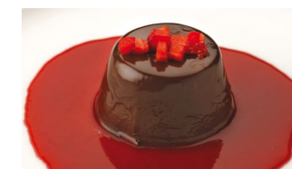
Panna Cotta de chocolate y fresa Coste por ración: 0,55€