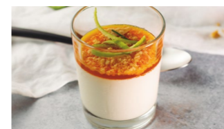
Pannacotta de especias Coste por ración: 0,44€