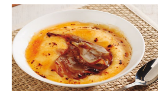
Crema Catalana con pera Coste por ración: 0,30€