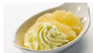
Mousse de limón con piña Coste por ración: 0,30€