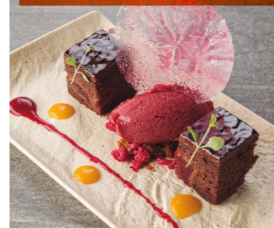
Brownie con sorbete de frutos rojos y coulis de mango