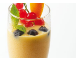
Sorbetto de mandarina Coste por ración: 0,55€