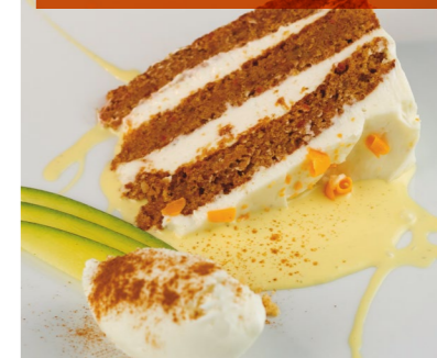
Carrot cake con helado de jengibre, vainilla y manzana