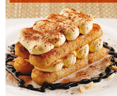
Milhojas de tiramisú con chocolate