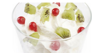
Mousse de coco con frutas Coste por ración: 0,30€