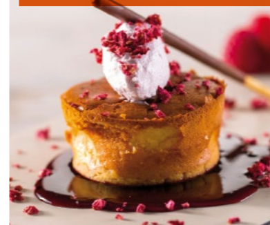
Cheesecake con helado de violeta en cama de cereza