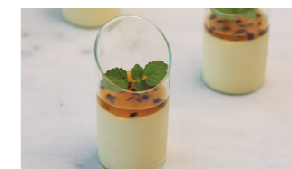
Pannacotta con mango Coste por ración: 0,55€