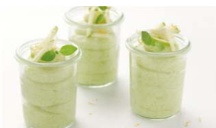
Sorbetto de manzana verde Coste por ración: 0,50€