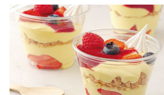
Natilla con frutos rojos Coste por ración: 0,35€