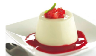
Pannacotta con coulis de fresa Coste por ración: 0,50€