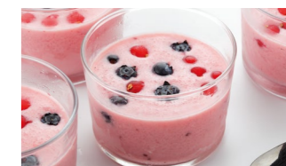
Sorbetto de frutos del bosque Coste por ración: 0,50€