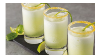
Sorbetto de lima limón Coste por ración: 0,35€