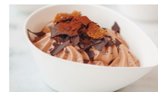
Mousse de avellana y chocolate Coste por ración: 0,30€