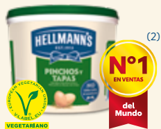
Hellmann's Pinchos y Tapas