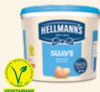
Hellmann's Salsa Suave