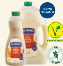
Salsa Mostaza y Miel